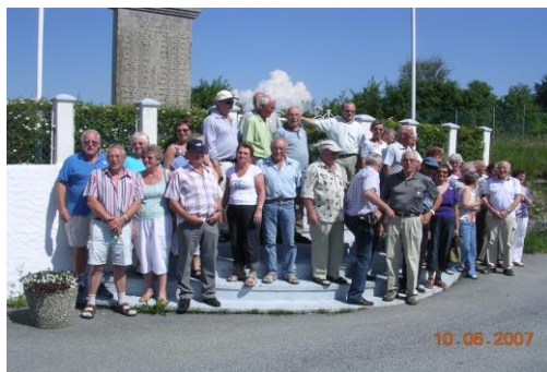
Telavåg, Karmøy (fl. gonger) og Sandeid/Vindafjord.

Denne ordninga starta alt i 2003. Så langt har me vore innom Austevoll, Utsira, Røvær, Fjell,