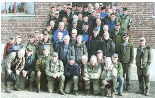
Første fellesturen med GPT Stord, nov. 2001

Turopplegget første hausten (2001) var ikkje omfattande. Me heldt oss i hovudsak innabygds. Men alt no hadde samarbeidet med Stordgutta starta, og den første fellesturen var den 08.11.2001 på Føyno.