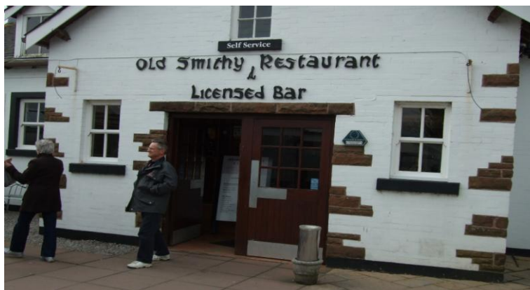
Smeden i Gretna Green var der kanskje, men ikkje brudepara ----.

Ein smak av Skottland fekk me også med oss.