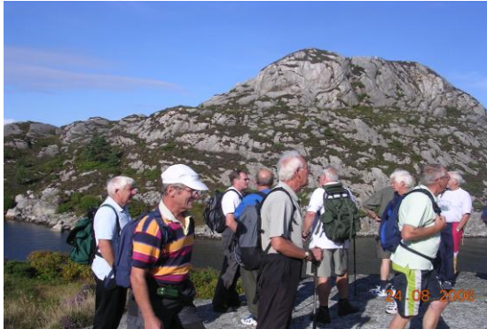
Klovafjellet - Hedlo