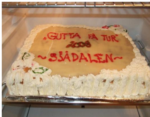
----med kake attåt.

Me har prøvt å få med oss noko kultur og annan informasjon på mange av turane – og kjenner vel vår eigen kommune som nabokommunane betre – og frå ei meir positiv