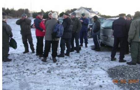
2008 - Me er blitt mange!