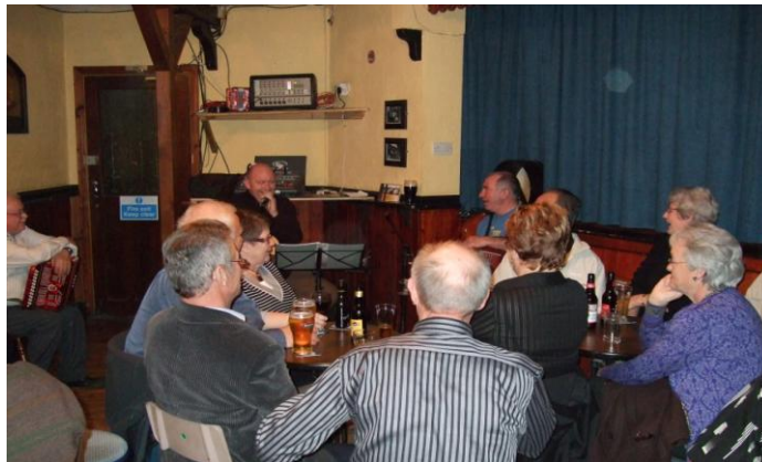
Fin stemning i Irsk pub

Ein smak av Skottland fekk me også med oss.