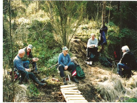
Ein pust i bakken

Mange nyttar seg av turstiane ”våre”, noko me set stor pris på. Serleg pris set me på at barnehagar og skuleklassar kjem seg ut i naturen. Grunneigarane har synt stor velvilje for arbeidet vårt.