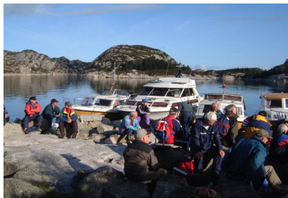
Gjenvisitt av GPT Stord til Samnungsøy

Seinare er samarbeidet utvikla til 4 fellesturar pr. år, 2 vår og 2 haust. Fellesskapet har gitt turgåinga og det sosiale fellesskapet ein ekstra dimensjon.