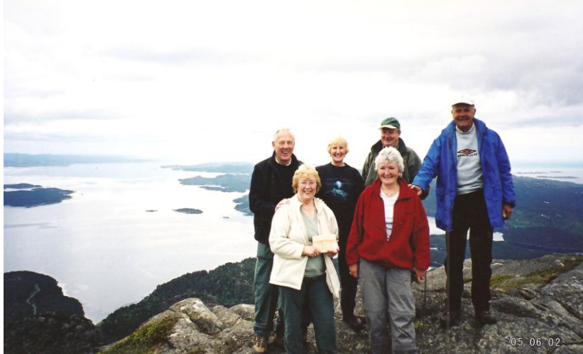
Engelske turvenner på vitjing, her på Siggjo.

Turen gav meirsmak – og 2 år etterpå var me tilbake til Durhamn, der me på nytt møtte dei same turvennene , var innom Aidensfield , Whitby og andre stader. Eit triveleg område. Nokre av dei turvennene me møtte i Durhamområdet har vore på gjesting hos oss.