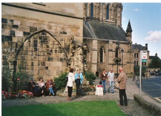
Kyrkja i Durham