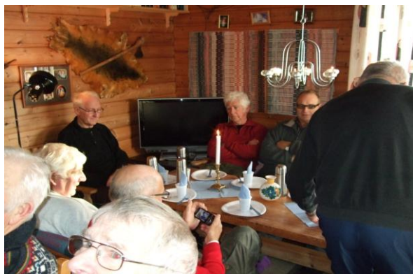
Juleavslutning på Magne si hytte