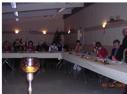
Årsfest i Erevik