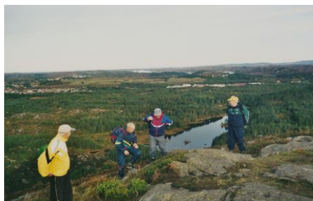
2001 - Få, men utvalde

Seinare auka interessa. Fleire har ønskt å delta, men førebels er det eit lite fleirtal som ønskjer ei avgrensing av medlemstalet for å gjera deltaking meir forpliktande – og for å ivareta det gode miljøet me har.